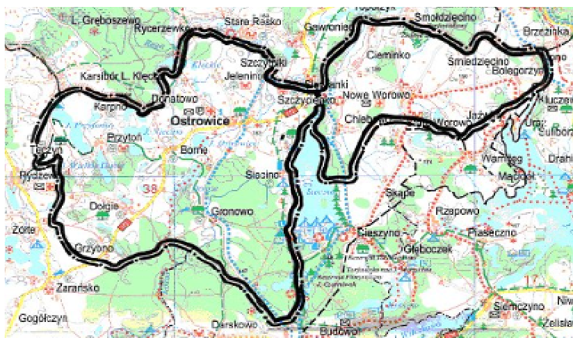
Mapa 1. Położenie Gronowa na tle Gminy Ostrowice